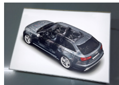
Nuit Vue nuit