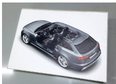
Jour Vue jour